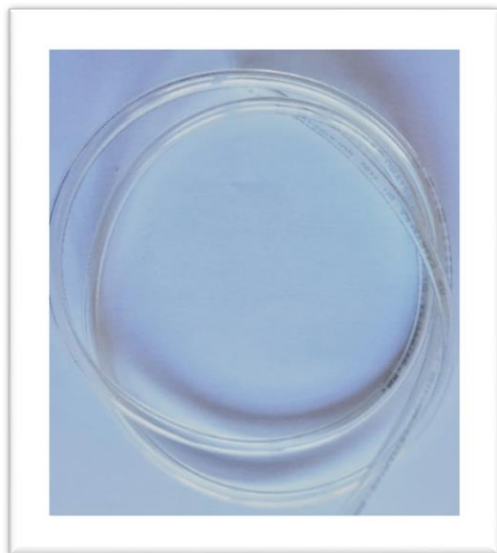
← RITZEN TUBE 6x4 6.