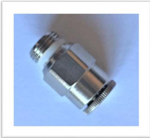
← INNESTO RAPIDO 1/8 4.